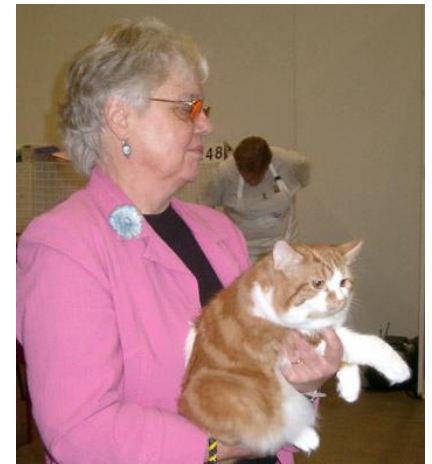
Raili ja Pena (Deimos Benvenuto)

Saatte tiedotteen mukana hallituksen jäsenten yhteystiedot ja ne löytyvät myös kotisivuilta, pitäkää yhteyttä meihin ja kertokaa toiveistanne ja myöskin kissoistanne, noita ihanista perheenjäsenistänne. Ei aina ole tärkeää, miten näyttelyissä menee tai kenen kissa voittaa. Pääasia, että manxit ja cymricit voivat kotonamme hyvin ja elävät onnellista kissan elämää.