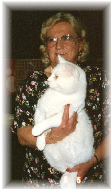
Leena v. 1997 sylissään EP&EC Kolun-katin Huggey, Askinkatin Nepin poika