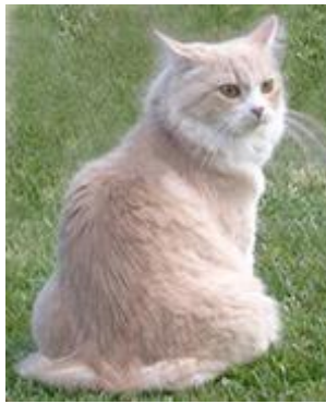
IC D'manns Naonar Nyn Onnor

Varsinainen jäsen 10,00 € Kasvattajan maksama uusi jäsen 8,00 € Tilinumero Nordea 140230-101614 Viitenumero 5005 Eräpäivä 5.2.2007